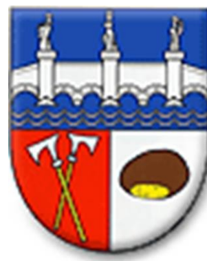
Město Bělá nad Radbuzou