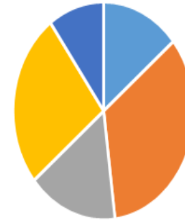
Jak obce vnímají komerční ubytovny