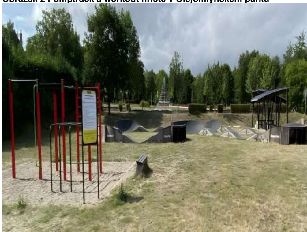
Obrázek 2 Pumptrack a workout hřiště v Olejomylnském parku