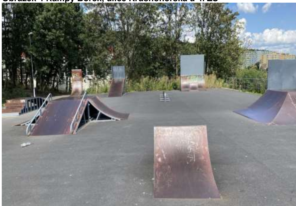
Obrázek 4 Rampy Borek, ulice Krušnohorská u 4. ZŠ