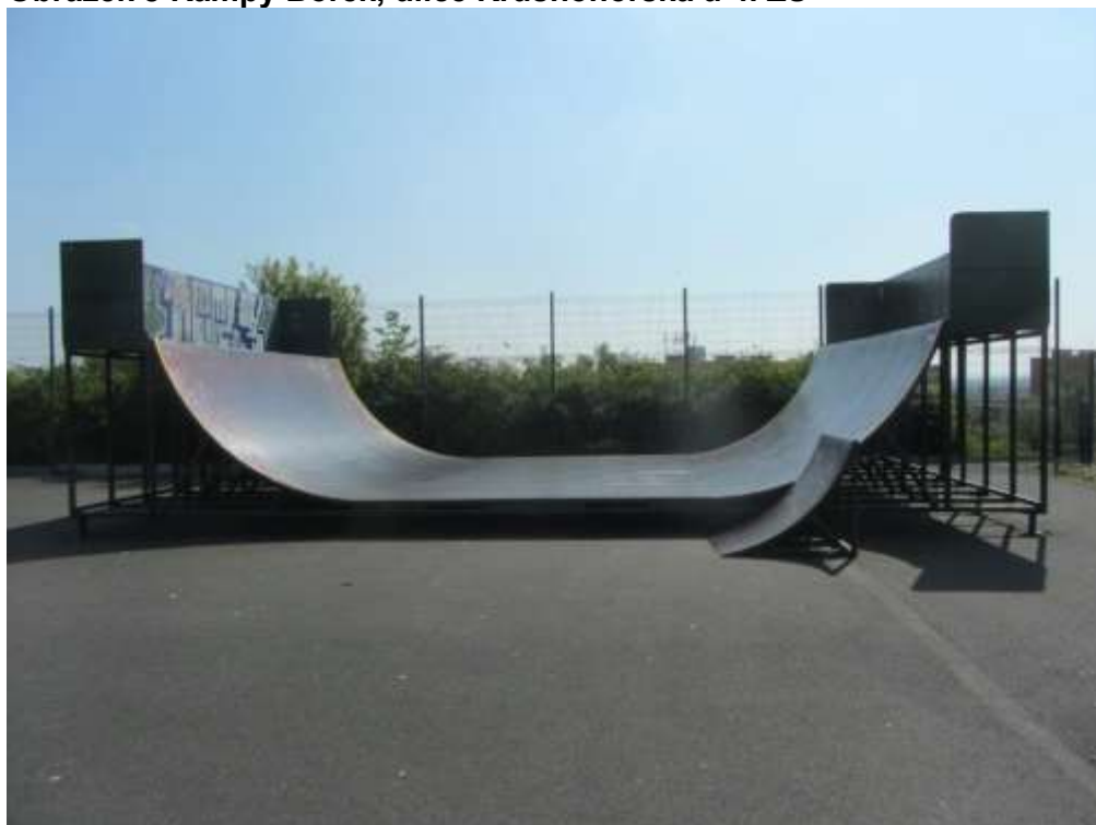
Obrázek 5 Rampy Borek, ulice Krušnohorská u 4. ZŠ