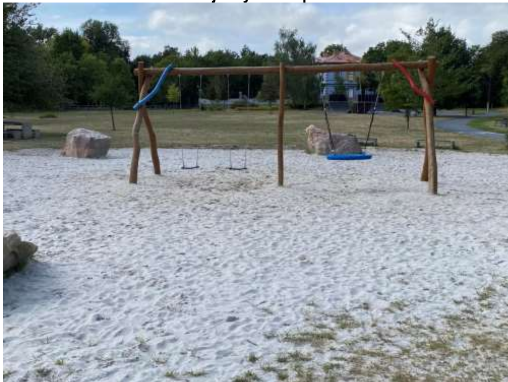
Obrázek 3 Dětské hřiště v Olejomylnském parku