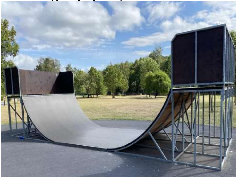
Obrázek 1 Rampy v Olejomylnském parku