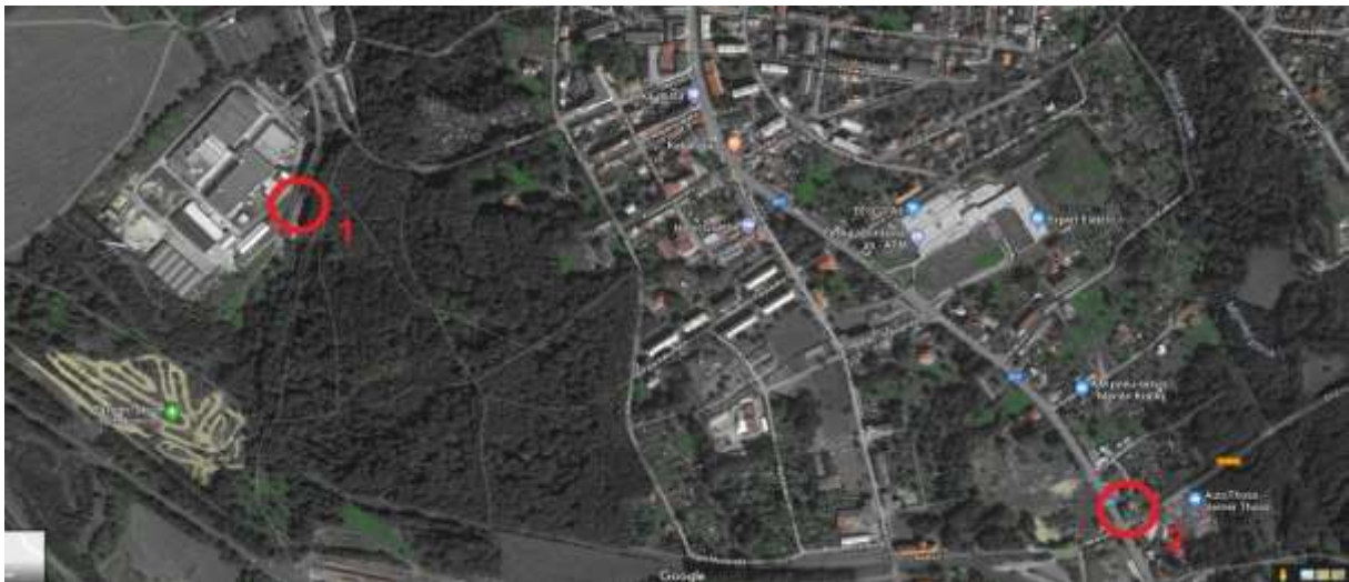
Obr. č. 2