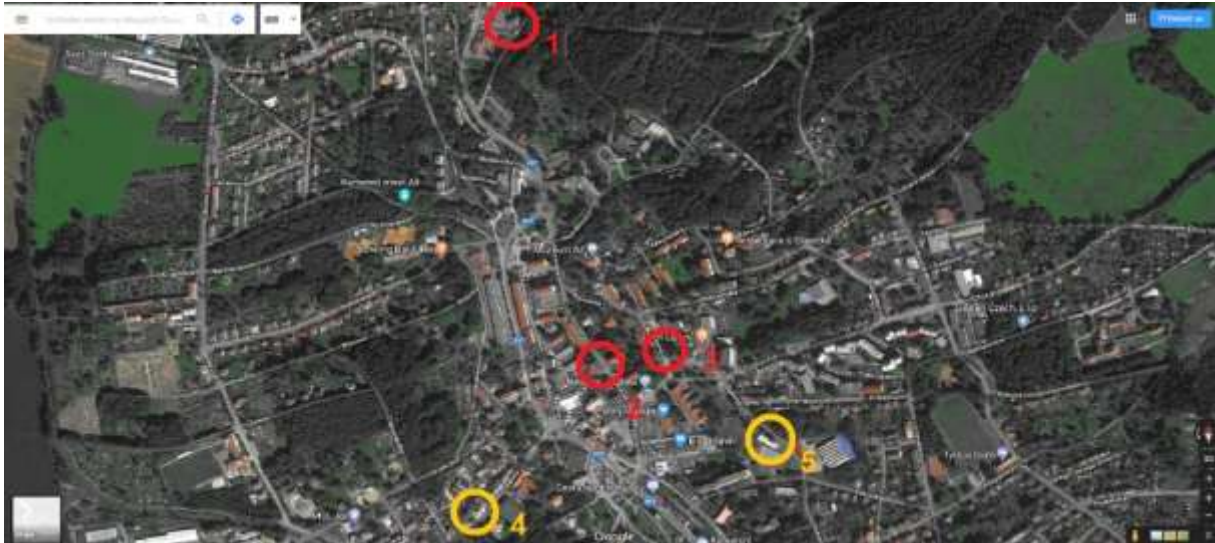
Obr. č. 1

Následující obrázky, převzaté ze Vstupní analýzy, znázorňují rozmístění objektů, které jsou v Aši v souvislosti se SVL zmiňovány nejčastěji. Žlutě označené jsou ubytovna a hotel, červeně pak bytové domy.