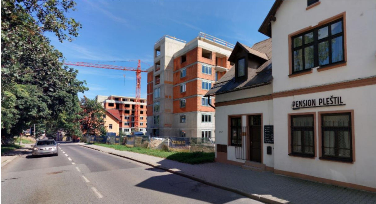
Obrázek 3: Rozestavěný projekt „Zahrada Gallas“