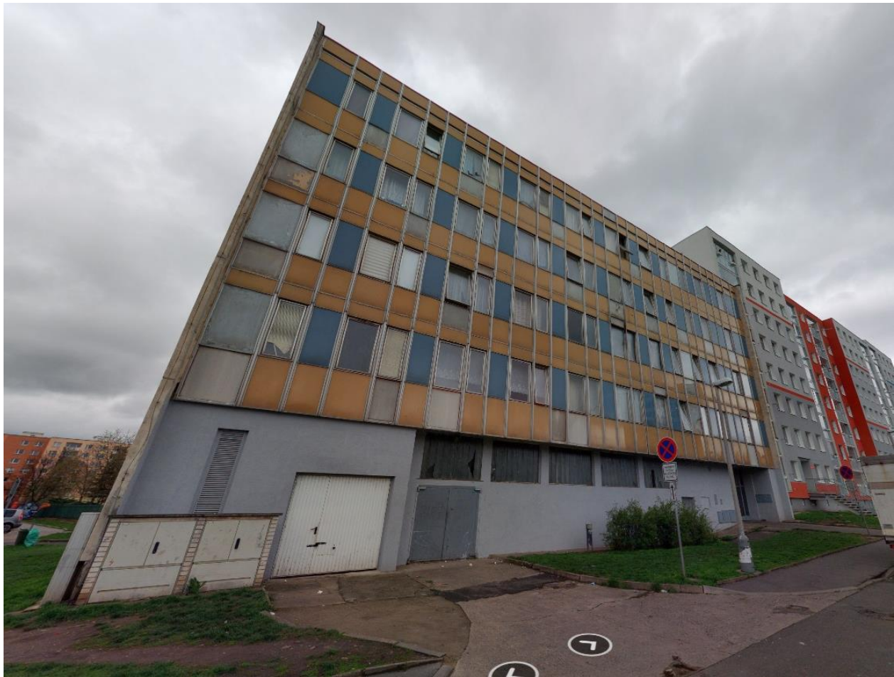
Obrázek č. 3: Budova v Přítkovské 1688/11, Mapy.cz, 2023